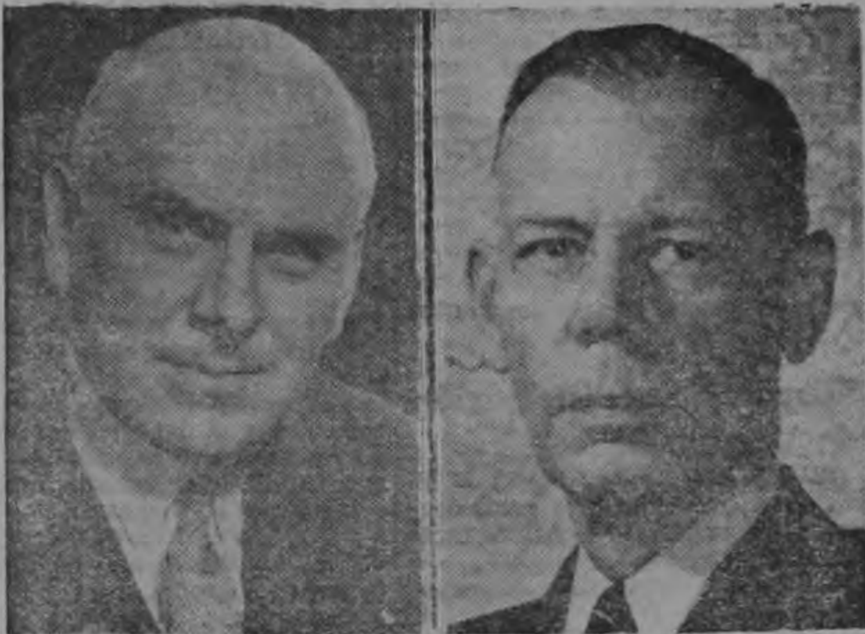
General Walter Bedell Smith (izquierda) y Sr. John J. McCloy, ambas personalidades internacionales que recientemente fueron electos directores de la United Fruit Company