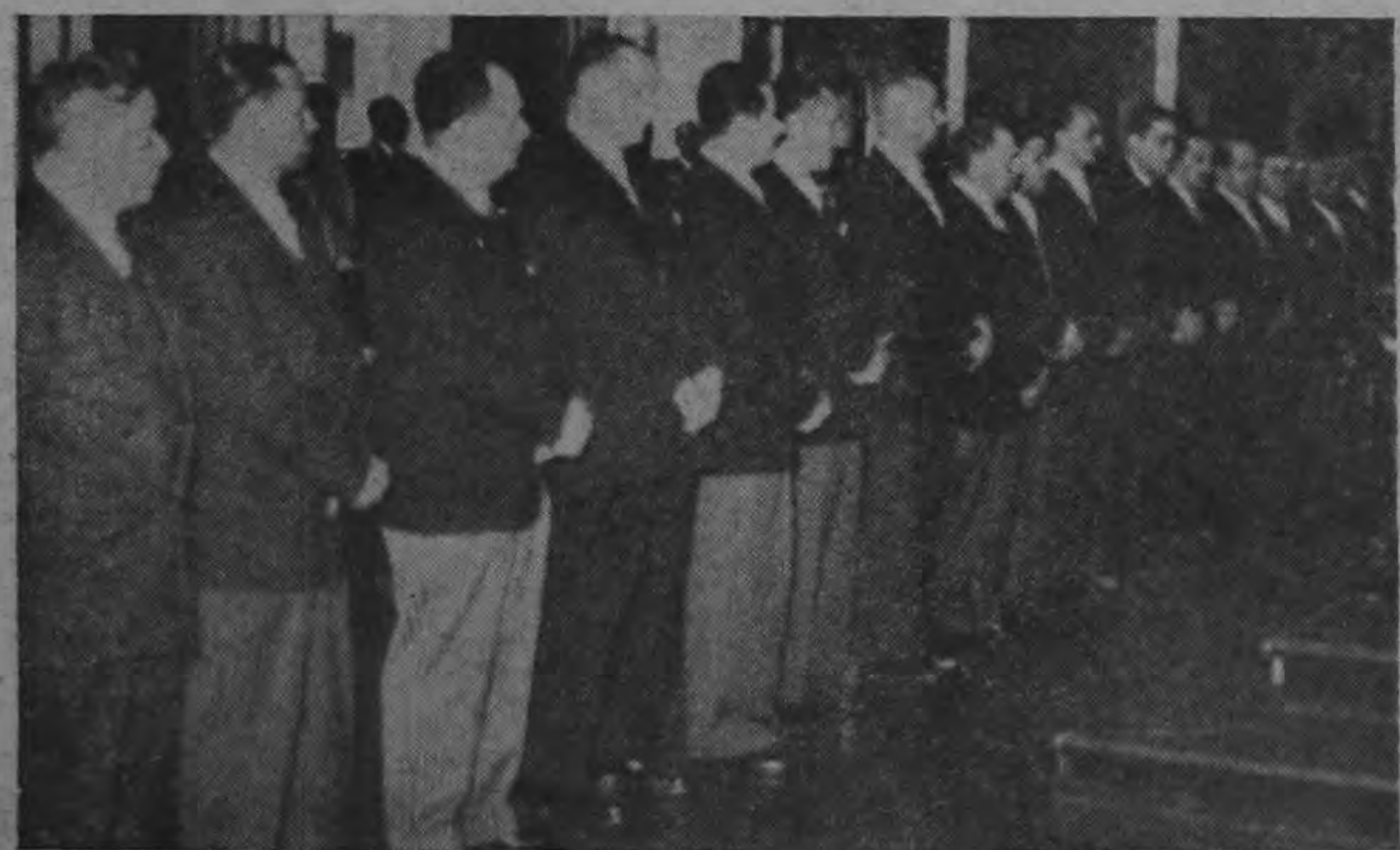
MAGISTRADOS DE LA CORTE SUPREMA DE JUSTICIA PRESTAN JURAMENTO.— Recoge la gráfica un aspecto del acto de juramentación de los Magistrados de la Corte Suprema de Justicia ante la Asamblea Legislativa. Los distinguidos jueces escuchan las palabras respectivas dichas por el Presidente de la Asamblea Licenciado con Gonzalo Facio.

JURAMENTO ANTE LA ASAMBLEA La ceremonia se efectuó a las 4 de la tarde, cuando el Secretario leyó el texto que ordena la Carta Magna, y el Presidente Facio les exhortó en nombre de la Patria, a cumplir sus deberes —(TEXTO EN LA PAGINA 15)—