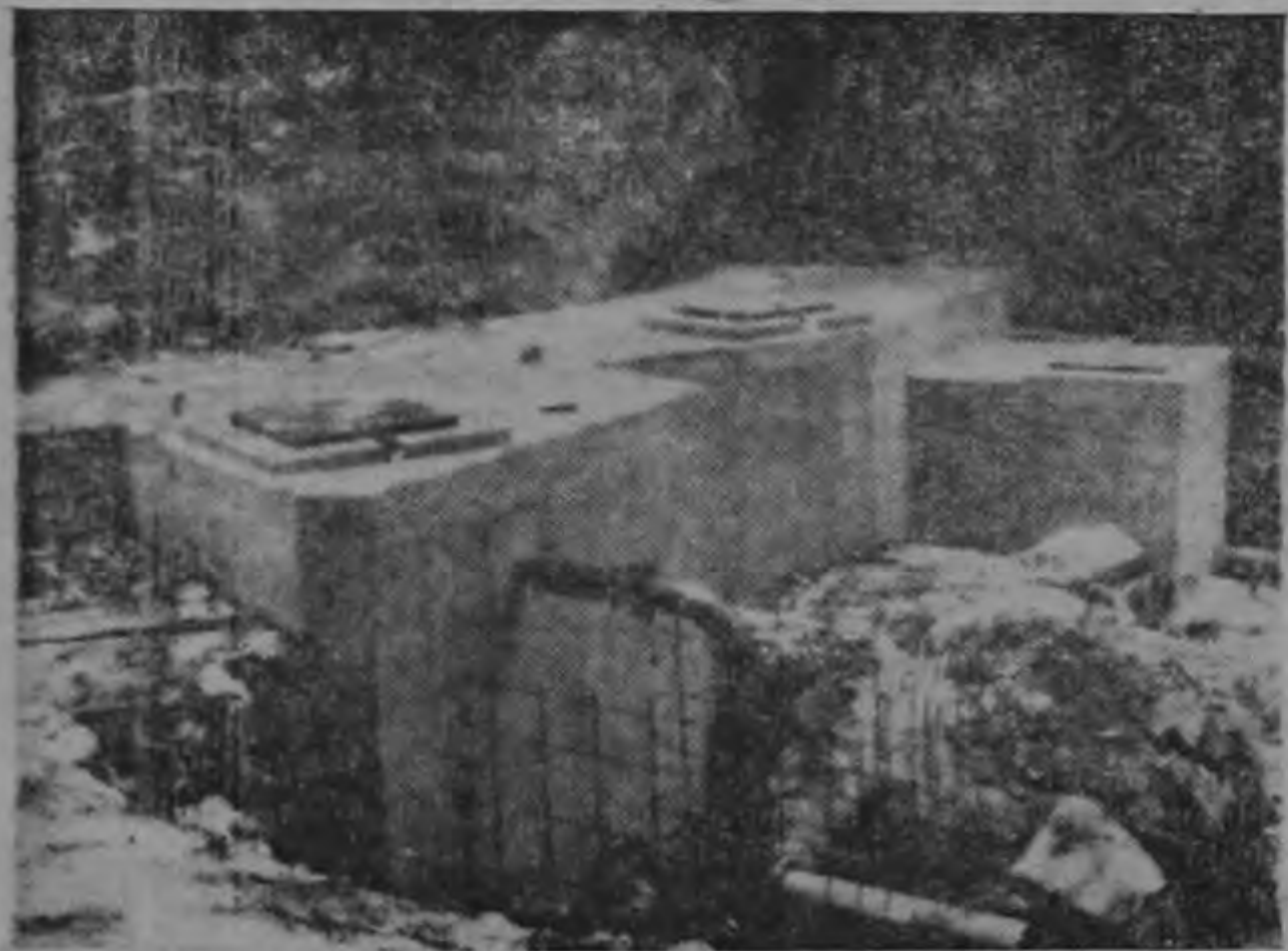
MOP CONSTRUYE CÁMARIAS — El tanque de captación de la ca- ñería construida, en el acopiamiento del Coco, tiene una capacidad para 102,000 galones. Ha sido diseñada para abastecer una población de 3,200 habitantes: empleados, pasajeros y habitantes de la zona. Esta cámara fue financiada en su totalidad por el Ministerio de Obras Públicas.

SINGAPUR 12 (INS) — Las autoridades implantaron esta noche la ley marcial en Singapur como secuela de los disturbios huelgueros y de los choques de violencia entre estudiantes y policías que arrojaron un saldo de 3 muertes. El número de los heridos no se ha anunciado oficialmente pero se tiene entendido que es de mayor consideración.