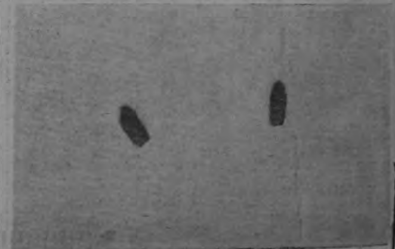
LAS BALAS HOMICIDAS.— Estos proyectiles de revólver calibre 38, fueron disparados por los asaltantes de Orosi y atravesaron por completo el cuerpo de Herminio Sánchez, ultimándolo.