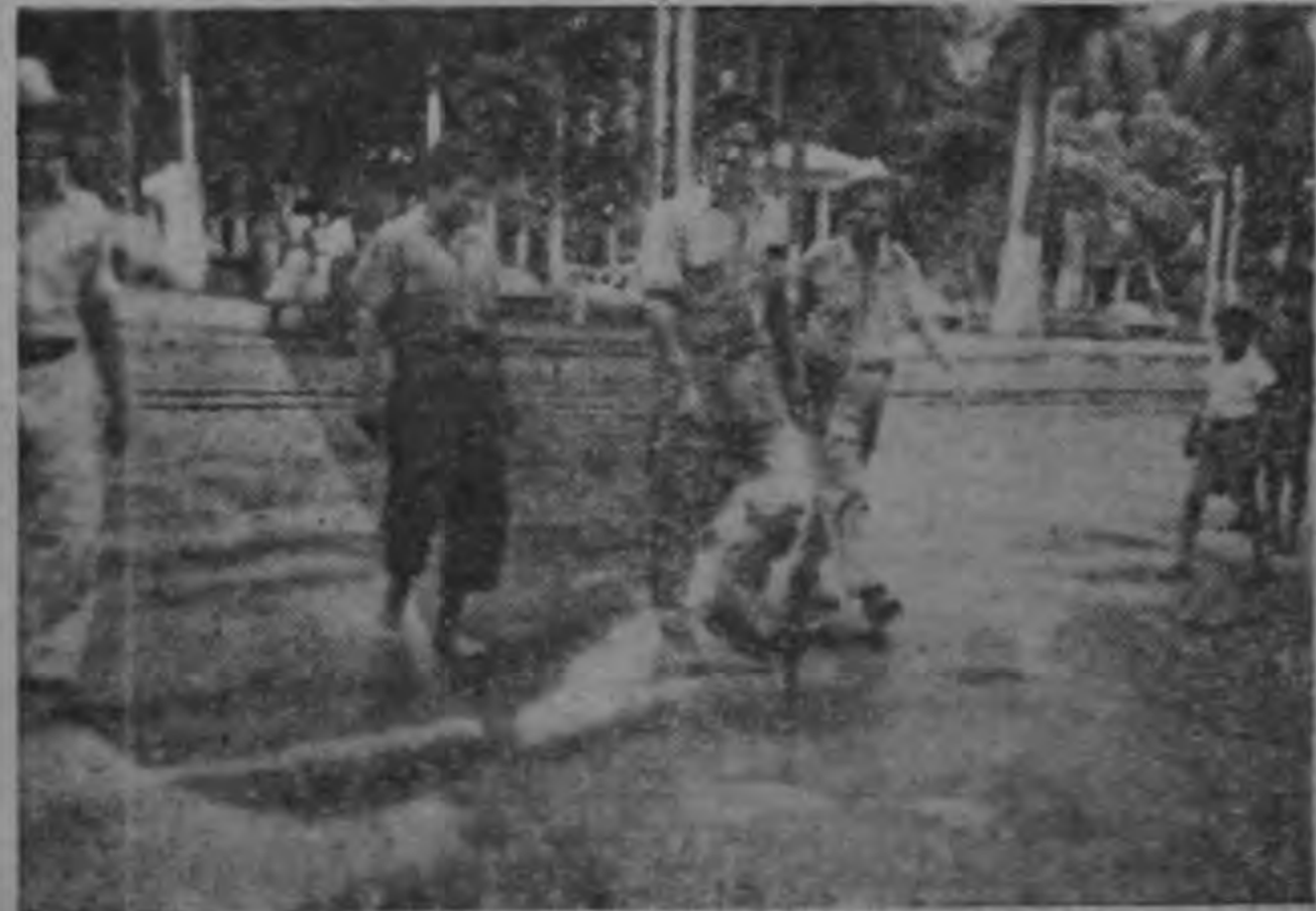
LOS CRIMINALES DE SANTA RITA DE COYOLAR.—Muestra la gráfica el momento en que los autores del horrible asesinato del padre e hijo en Santa Rita, abandonaban la Alcaldía de Orotina, tras de rendir declaración indagatoria. Dos guardias civiles, debidamente armados, los conducen hacia la prisión.