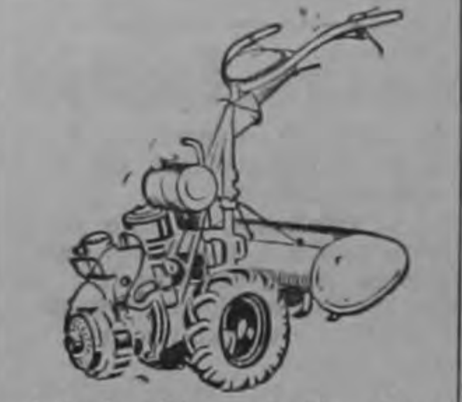
Antonio Lines & Cia. Ltda. Frente a Singer. Teléfono 4963.

MAQUINARIAS TRACTORES para Agricultura Agría.